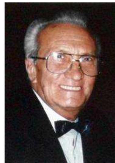
Foto sulla tomba.