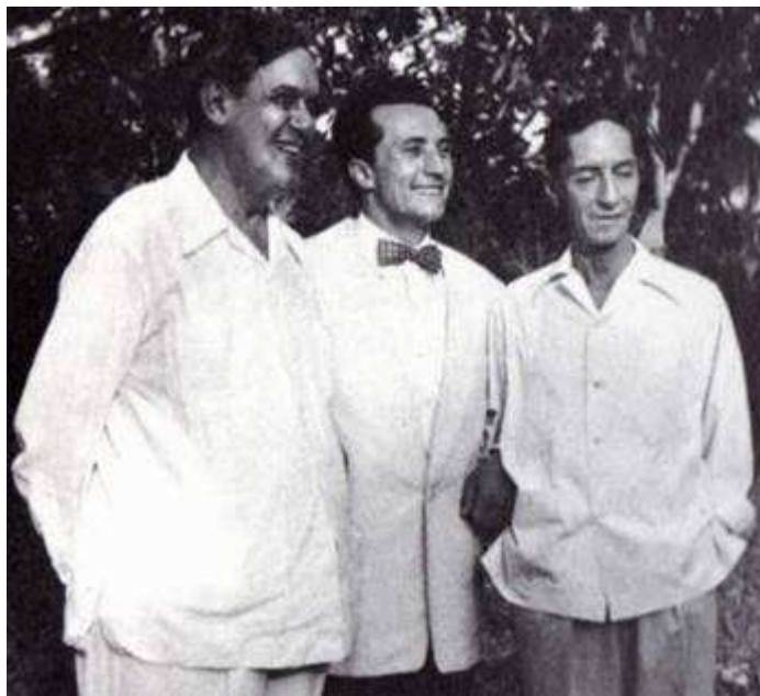
Con Ernesto Lecuona e Augustin Lara.