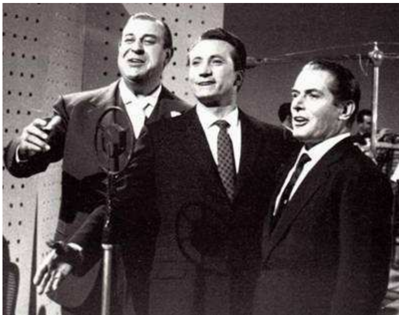
Con Alberto Rabagliati e Natalino Otto, nel 1963.