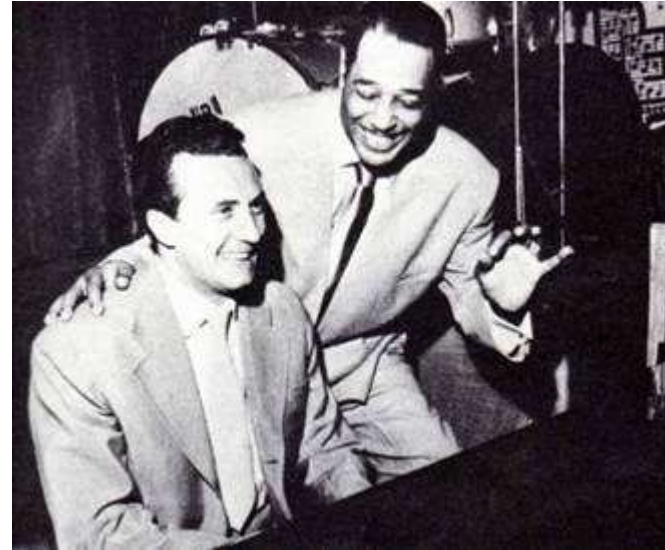
Con Duke Ellington.