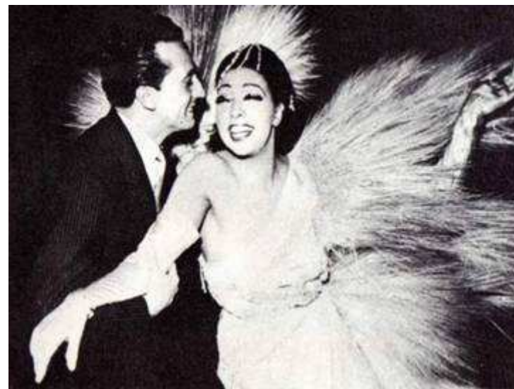
Con Josephine Baker.