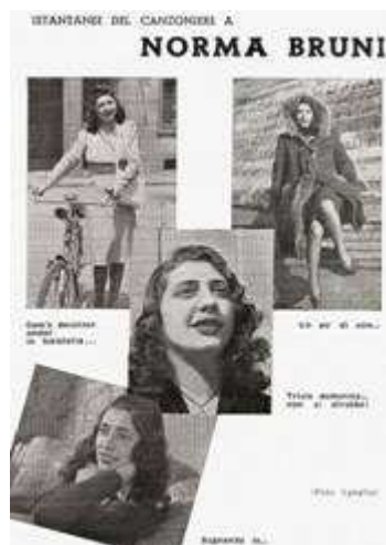
«Il Canzoniere della Radio», n. 53, 1° Febbraio 1943, p. 27.