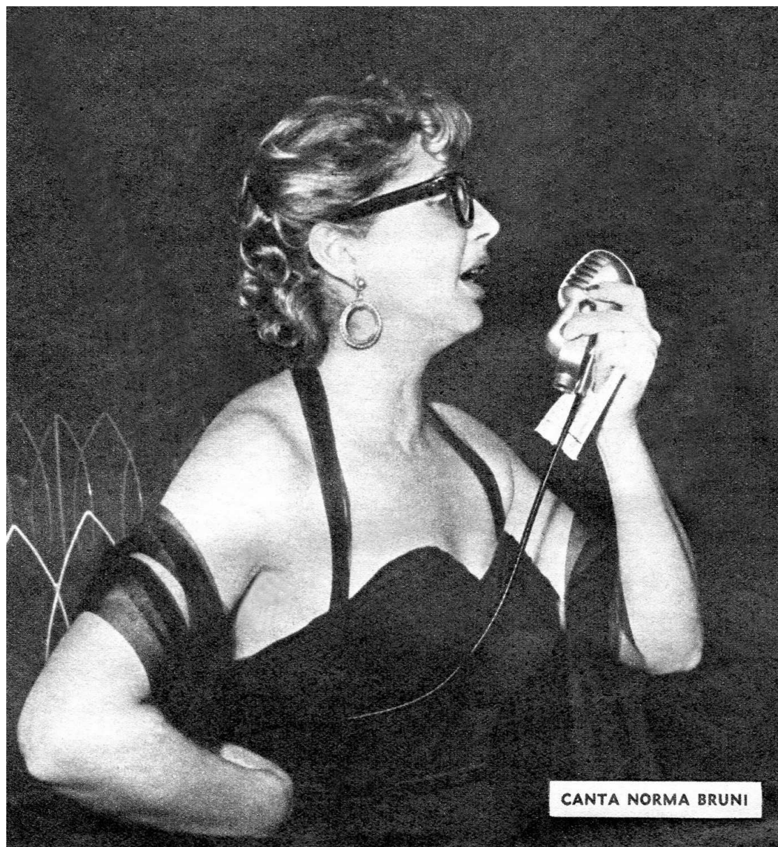
Da «Sorrisi e canzoni», Gennaio 1956, n. 3, p. 4.