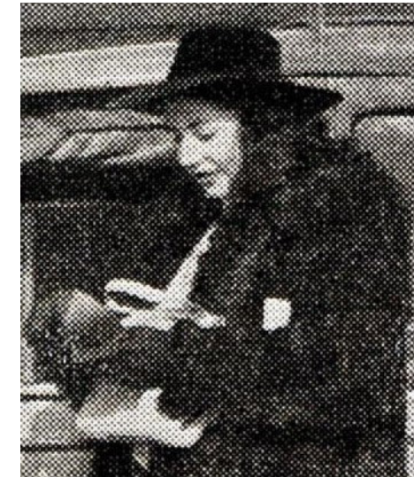
«Il Canzoniere della Radio», n. 60, 15 Maggio 1943, p. 30.