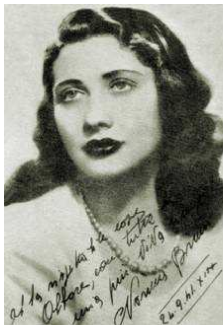
A sinistra: cartolina Aser n. 008; a destra: foto dal volume di Pietro Osso, Interviste ai divi della Radio , Milano, Casa Editrice "Albore", Novembre 1941, p. 6.