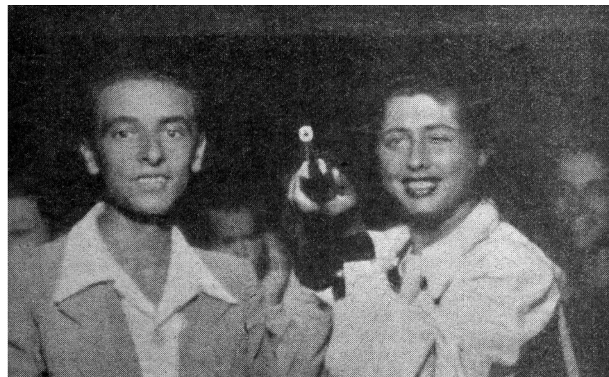
Al tiro a segno.