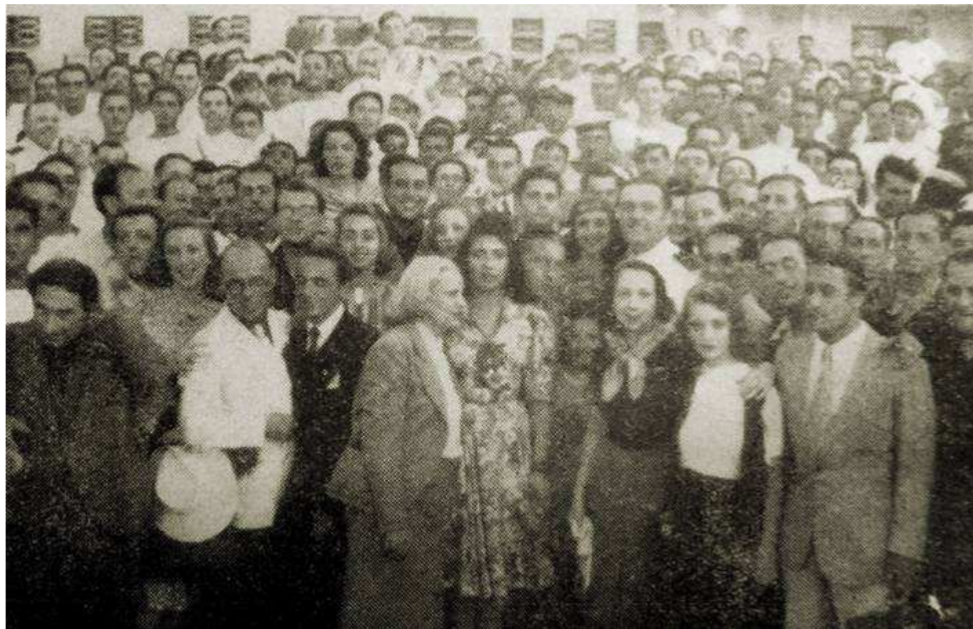
Illustrazioni* dal «Radiocorriere»: n. 20 dell'11-17 Maggio 1940, p. 11, e n. 33 dell'11-17 Agosto 1940, p. 12.