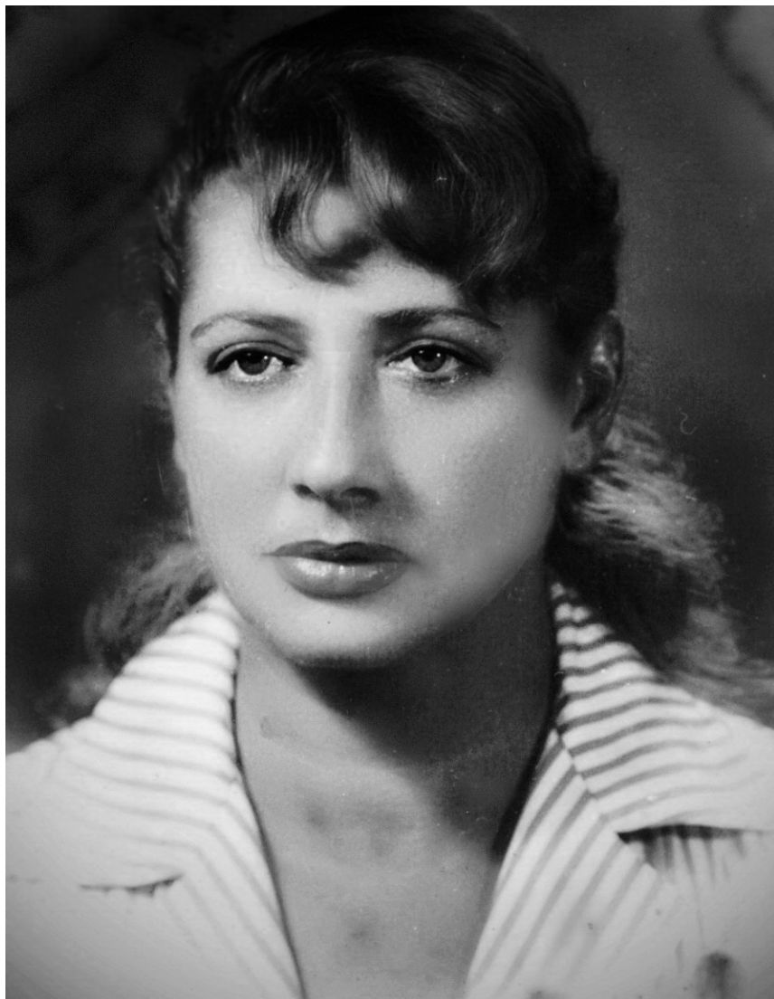
Foto sulla carta di identità.