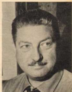
Anton Giulio Majano è il regista dello spettacolo di varietà televisivo Sentimentale a cui parteciperanno Mina, Nicola Arigliano e l'orchestra di Lelio Luttazzi.