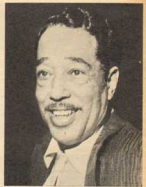
Duke Ellington costituisce senza dubbio la principale attrazione del programma musicale in onda ogni alle 19,15, nel quale figurano nomi di primo piano del jazz americano.