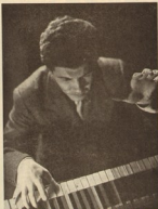
Del film di CH. CHAPLIN "LUCI DELLA RIBALTA" AI 10128 "ARLECCHINATA" (Eternamente)